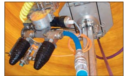
Der Wasserstrahl aus zwei Düsen am Teleskoparm entfernt den Schmutz von den Innenwänden des Silos.