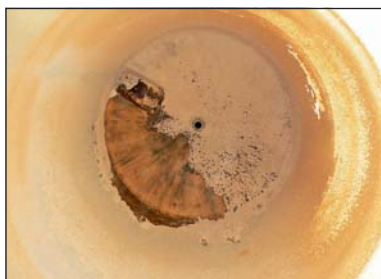
Futterrückstände haben sich von der Silowand abgelöst.

Doch selbst wenn die absolute Notwendigkeit und auch der Wille zur Reinigung besteht, ist diese nicht immer möglich. Es fehlt ganz banal die Einstiegs Luke, um in das Innere des Silos zu gelangen. K. B.